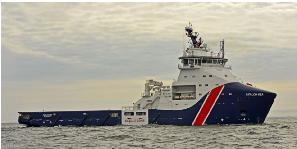
Zbudowany w stoczni Remontowa Shipbuilding statek klasy AHSV „Avalon Sea”.