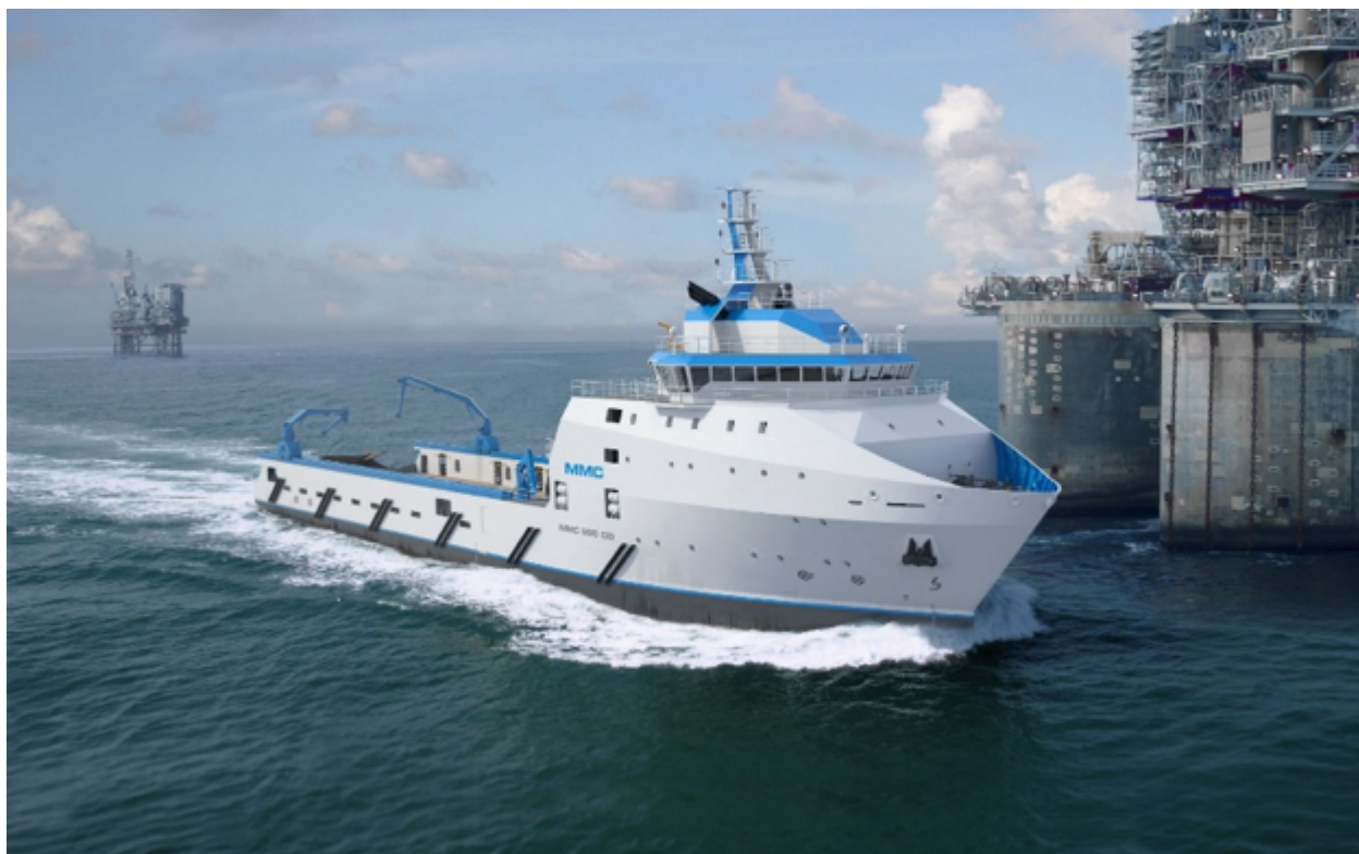
Projekt jednostki klasy AHTS opracowanej przez polskie biuro projektowe MMC.

Polska jest w o tyle dobrej sytuacji, że ma również bardzo dobre biuro projektowe MMC specjalizujące się w branży offshore, które w ciągu ostatniej dekady zaprojektowało ponad osiemdziesiąt różnych statków wykonujących swoje zadania na akwenach całego świata. Są wśród m.in. jednostki klasy: PSV, AHTS i MPSV (Multipurpose Vessel).