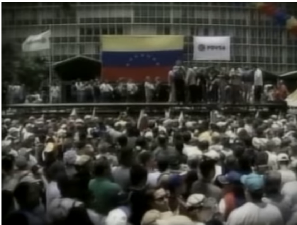
Demonstracja sił opozycyjnych przed siedzibą PDVSA

Doszło do starć z udziałem demonstrantów, policji oraz wojska w wyniku, których zginęło 19 osób, zaś ponad 100 zostało rannych. Najbardziej zacięte walki toczyły się na moście Llaguno i jego okolicach.