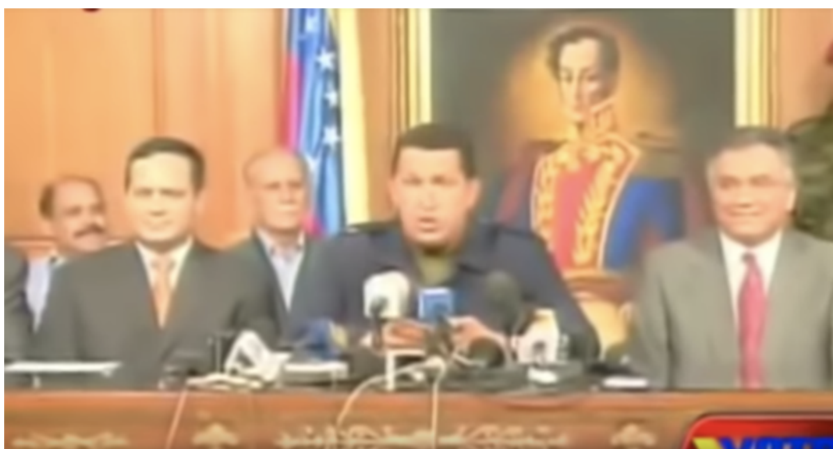
Wystąpienie Hugo Cháveza po powrocie do Miraflores

Zmiany okazały się jednak krótkotrwałe, ponieważ nowy rząd musiał stawić czoła masowym protestom zwolenników Cháveza, którzy domagali się jego uwolnienia i powrotu do władzy. 14 kwietnia, po udanym szturmie na Miraflores, upadł rząd Carmony, zaś stery kraju objął wiceprezydent Diosdado Cabello - zapowiadający, że jego celem jest „zabezpieczenie” posady do powrotu Cháveza. Ten z kolei wkrótce został zwolniony z więzienia wojskowego na wyspie La Orchila i powróciwszy do stolicy ponownie objął urząd prezydencki.